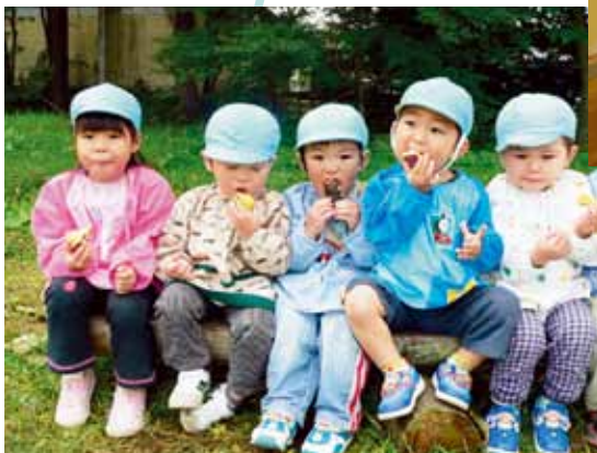
柏学園自然教育園どんぐり広場「やきいも」

かしわ幼稚園 ☎32-5180 第二かしわ幼稚園 ☎33-9411 柏学園 ひまわり幼稚園 認定こども園 ひまわり保育園 ☎32-0971