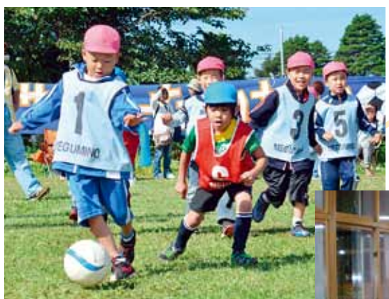
柏学園自然教育園青空広場(サッカー場)